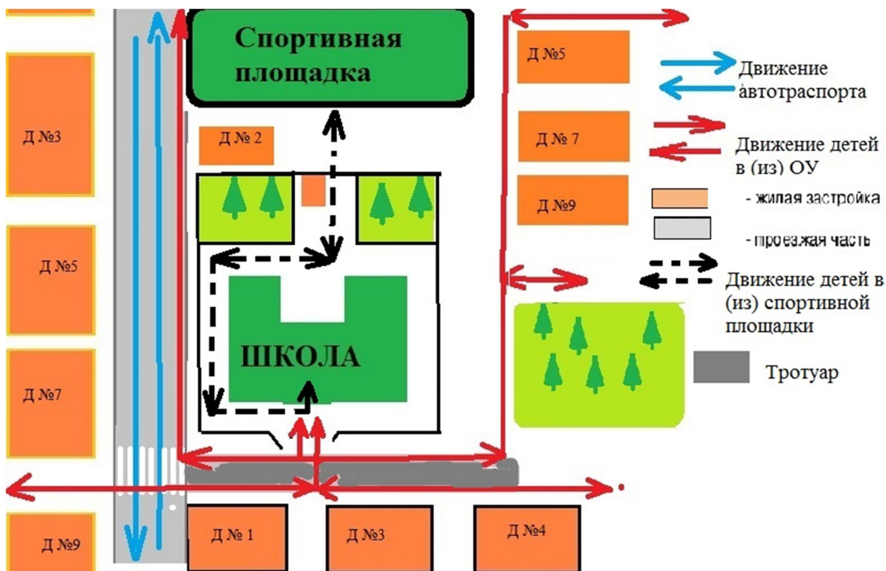
Схема организации дорожного движения