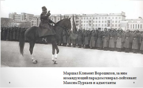
Маршал Климент Ворошилов, за ним командующий парадом генерал-лейтенант Максим Пуркаев и адъютанты

Для армии Победы куйбышевский парад 1941 года фактически стал первой важной операцией в ее истории.