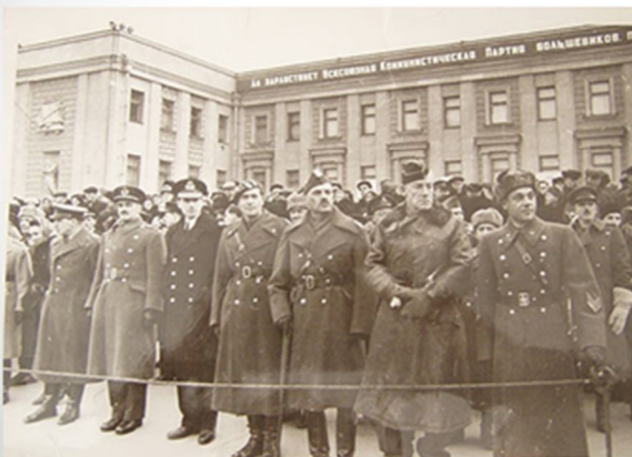
Иностранцы смотрели военный парад 7 ноября 1941 года из первых рядов.

В случае падения Москвы, в которой продолжали оставаться Ставка Верховного Главнокомандования, Государственный комитет обороны и Генеральный штаб РККА, Куйбышев должен был стать новой столицей СССР.